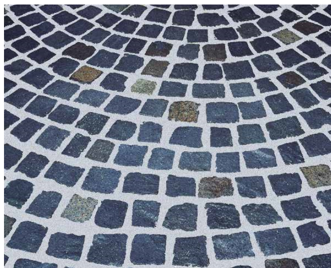
10 Gotowa, zafugowana nawierzchnia brukowa.