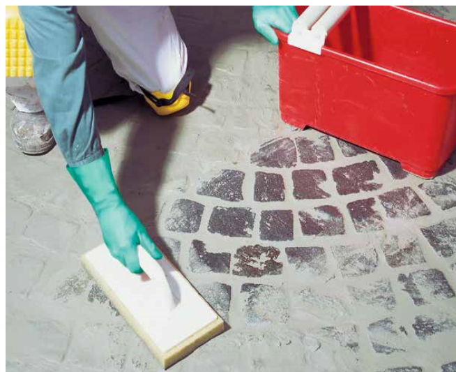
8 ... lub pacą gąbkową.