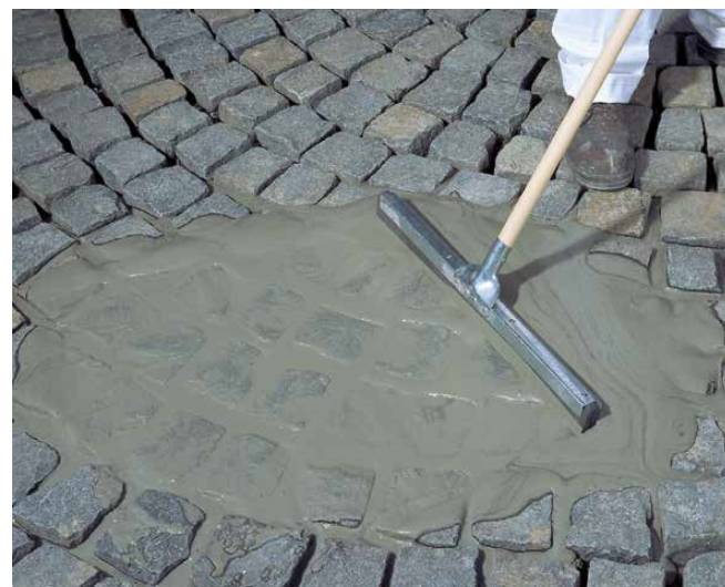
6 Wypełnienie spoin samozagęszczającą się zaprawą Sopro PFM.