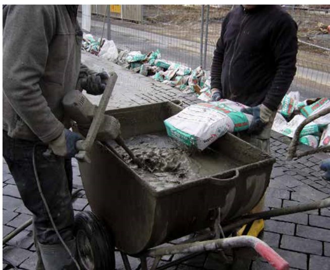
4 Alternatywnie: mieszanie fugi przy pomocy mieszarki do zapraw.