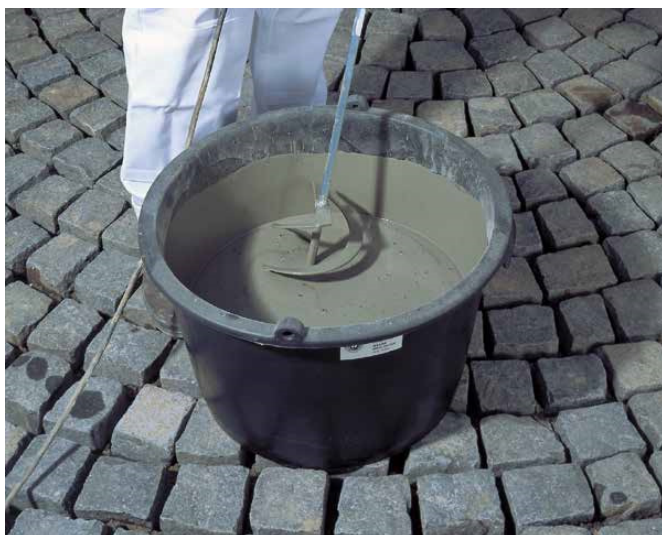
3 Mieszanie fugi Sopro PFM przy pomocy mieszadła śrubowego.