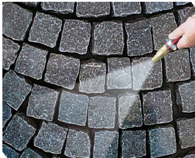
2 Nawilżona i oczyszczona nawierzchnia przygotowana do spoinowania.