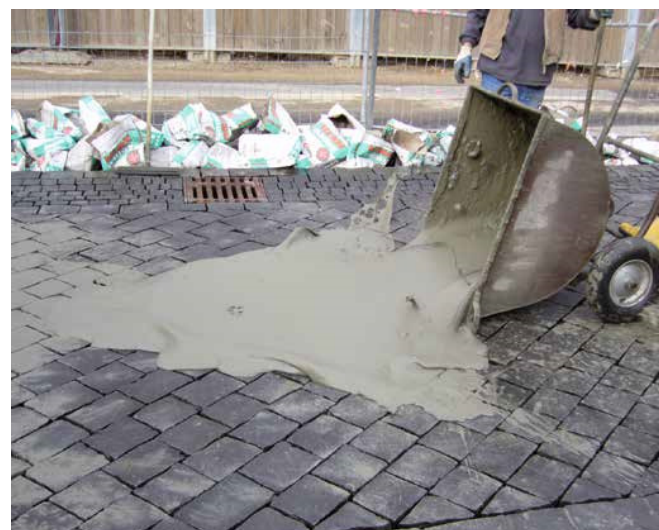
5 Łatwe wypełnienie szczelin dzięki doskonałej rozplýwności fugi.