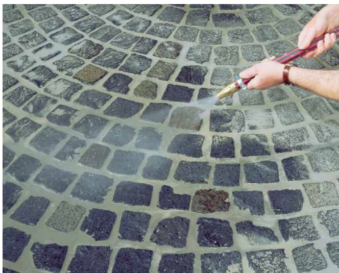
9 Zmywanie zaspoinowanej powierzchni po wstępnym związaniu zaprawy fugowej przy pomocy węża z końcówką do zraszania.