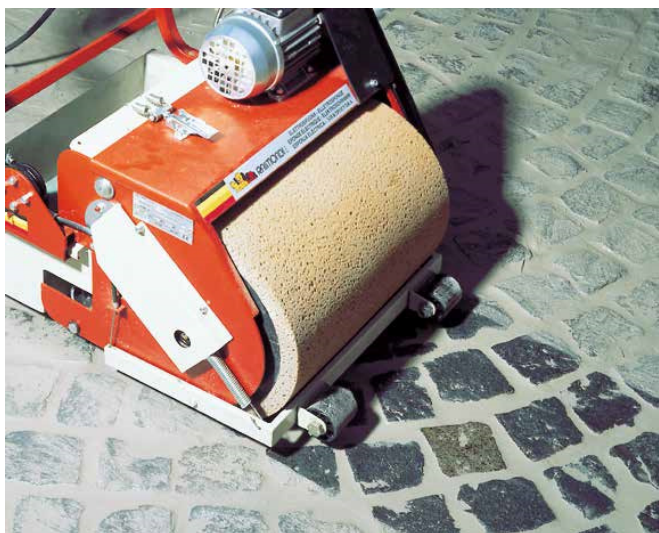
7 Zmywanie zaspoinowanej nawierzchni przy pomocy maszyny do zmywania fug...