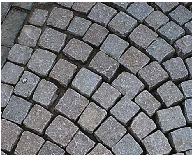
1 Nawierzchnia z kamiennej kostki brukowej o różnej szerokości szczelin spoinowych.